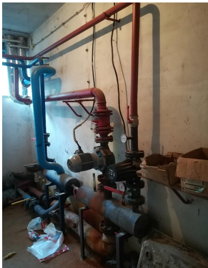
Слика 1. Топлотна подстананица у Хемијско-медицинска школа – постојеће стање